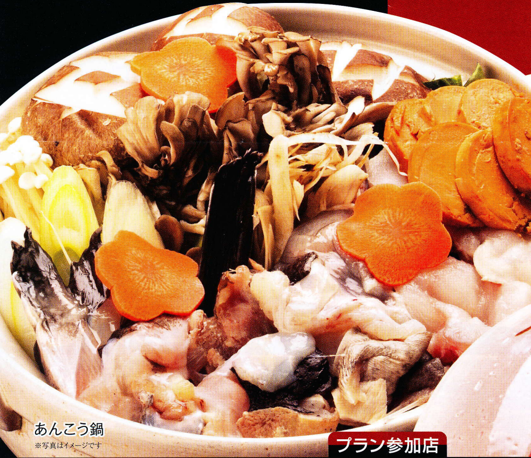
あんこう鍋 ※写真はイメージです